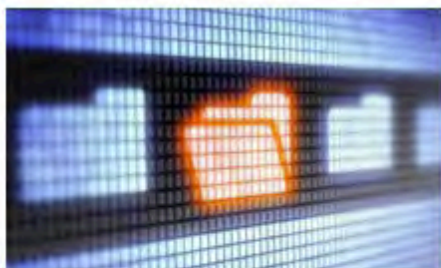
FLOT : Bases de données relationnelles