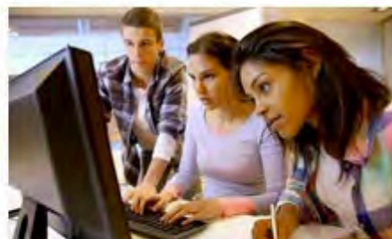
FLOT : Programmation en Python pour débutants