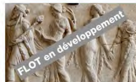
FLOT : Version grecque