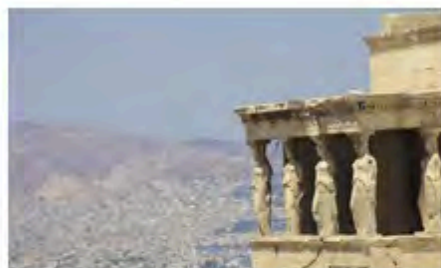
FLOT : Grec ancien pour débutants