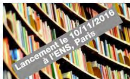
FLOT : Grammaire élémentaire de la langue française