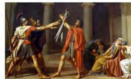
FLOT : Latin pour débutants