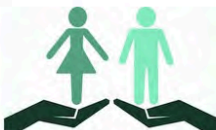
FLOT : Être en responsabilité demain : se former à l'égalité femmes-hommes