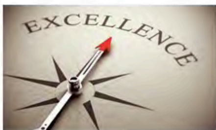
FLOT : Vers l'excellence professionnelle