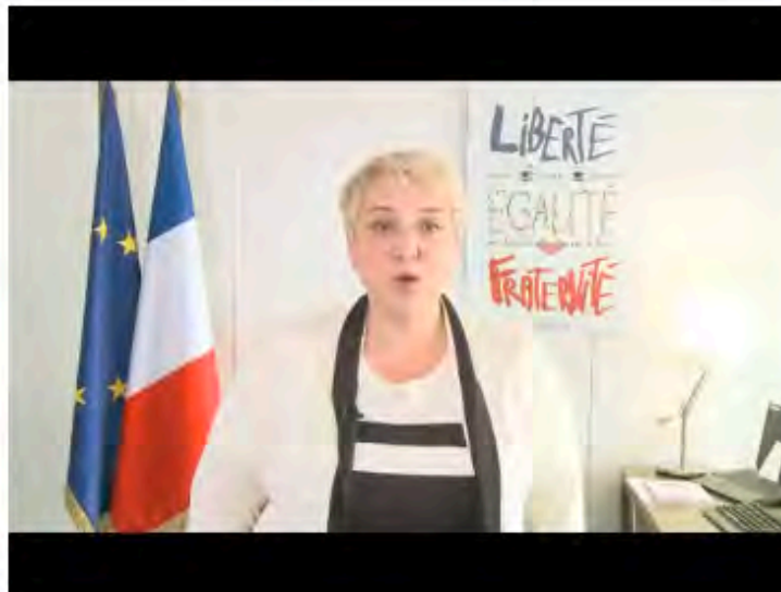
Séquence 1 de la formation Auto-évaluation finale de la séquence 1