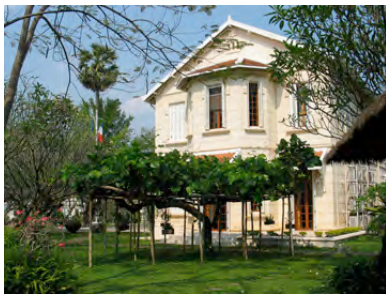
L'ambassade de France au Laos, Vientiane